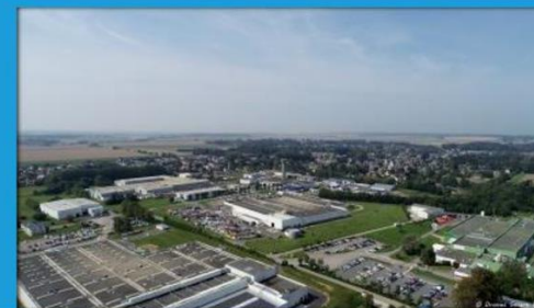
Ci-dessous : photo vue aérienne Parc Industriel Offranville