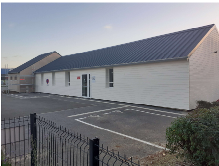
En cours de travaux